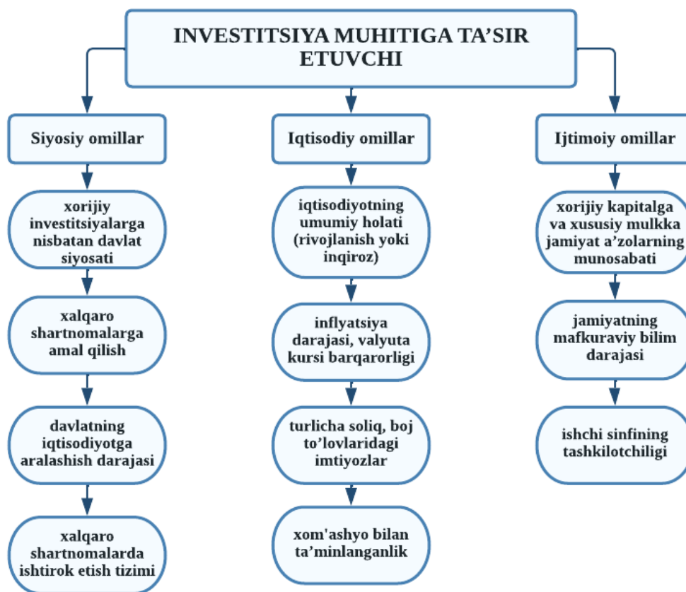
1-rasm. Mamlakat investitsiya muhitiga ta'sir etuvchi omillar [9]

Investitsiya muhiti makroiqtisodiyot darajasida, ya'ni investor va aniq davlat organlari, xo'jalik subyektlari o'rtasidagi munosabatlarda o'z aksini topadi. Investitsiya muhiti har qanday aniq vaqt uchun obyektiv holat bo'lib, capital qo'yish uchun mavjud sharoitlarning majmuasini o'zida qamrab oladi. Lekin investitsiya muhiti davlat organlarining boshqarish faoliyati ta'sirida shakllanadi. Shuning uchun davlatning investitsiya siyosati eng omillardandir. Shu ma'noda har bir davlat kapital import qilishda o'zining aniq kapital qabul qilish tizimiga ega bo'adi. Investitsiya muhiti darajasi qanchalik yomon bo'lsa, investor o'z riskini shunchalik yuqori belgilaydi. Investitsiya muhitining makroiqtisodiy darajada quyidagi rasm ko'rinishida tasvirlash mumkin (1-rasm)