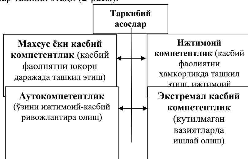
2-расм. Касбий компетентликнинг муҳим таркибий асослари (Б.Назарова)

Ўзбекистон Республикаси шароитида ҳам мутахассис (тадбиркор)га хос касбий компетентликнинг ўзига хос жиҳатлари ўрганилган бўлиб, улар орасида Б.Назарова томонидан олиб борилган тадқиқот ўзига хос аҳамият касб этади [3]. Тадқиқотчининг фикрига кўра мутахассисга хос касбий компетентлик негизини қуйидаги таркибий асослар ташкил этади (2-расм):